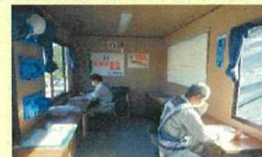
現場事務所での対人間隔の確保と換気