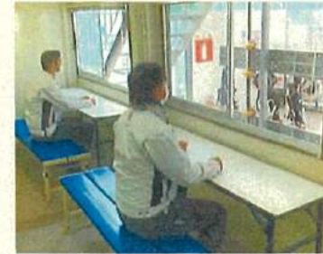
休憩室の窓の常時開放