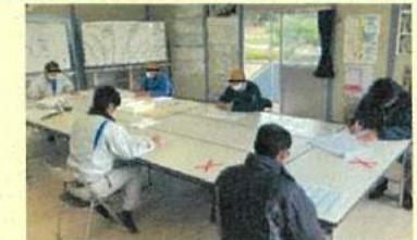
打合せ時の十分な対面距離の確保