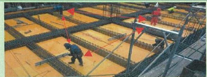
作業員の配置をブロック分けし密接した作業を回避