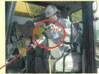
ハンドルやレバー等のアルコール消毒の徹底