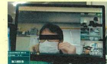
Web会議による打合せ