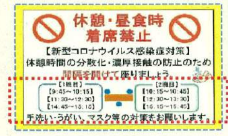
時間差による休憩時間の分散化