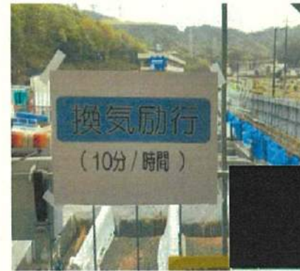
作業場所は定期的に換気する