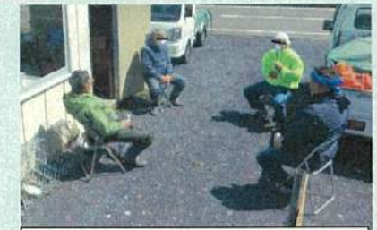
屋外で対人距離を確保して休憩