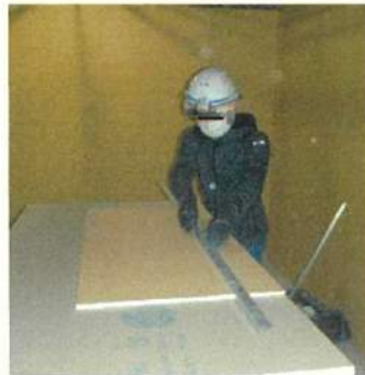
作業時のマスク着用