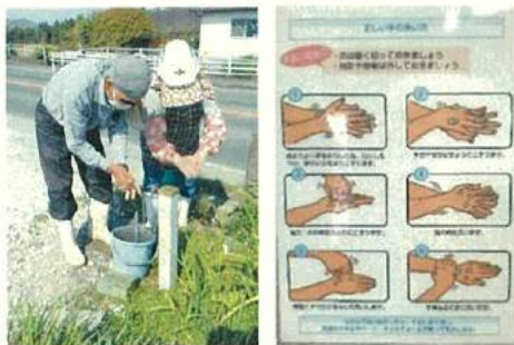
作業場所での手洗い励行

テレワーク中の担当者でも、自宅でPC等で確認・指示・注意を行うことができ、テレワークの活用と現場における対人接触の低減に資する