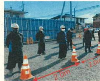
作業員間の一定距離の確保