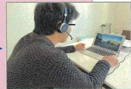
テレワークでの現場確認状況