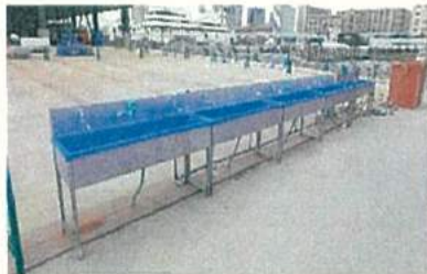
現場の手洗い場所の増設