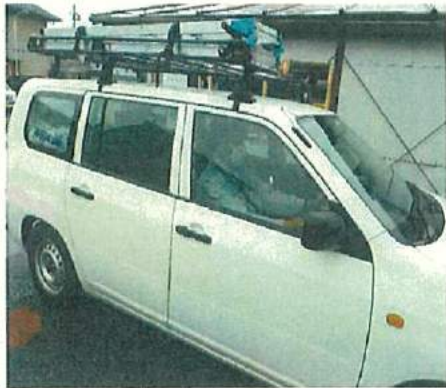
現場移動では同乗を避けて 個人で移動