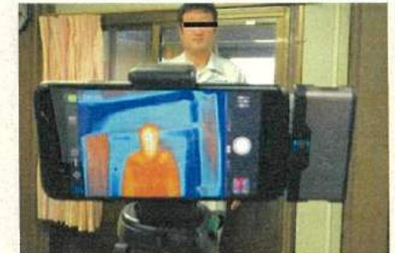
サーモグラフィーカメラによる体温計測