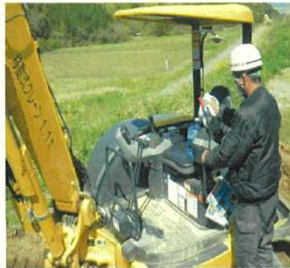
重機のレバーはこまめに消毒