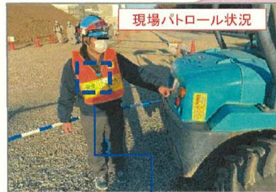
携帯Webカメラ着用状況