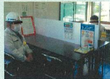
パーティションで密接を防止