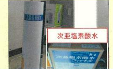
次亜塩素酸水対応の加湿器等を設置