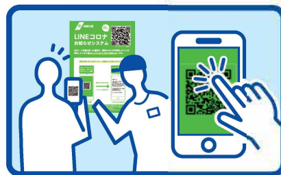
来店者にQRコードを 読み取って貰ってください