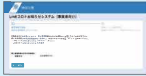
LINEコロナお知らせシステム 登録フォーム