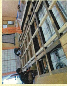
工程を分けて少人数で作業