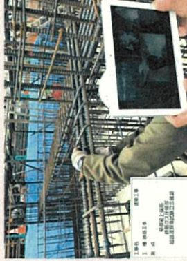
Webカメラを利用した遠隔検査