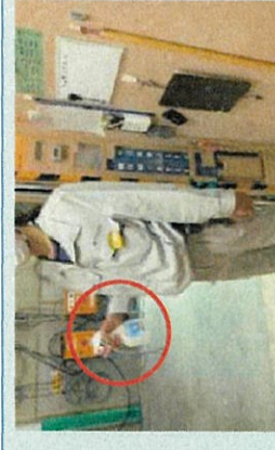
EVの操作盤等の消毒を徹底