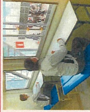
休憩室の窓の常時開放