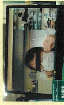
Web会議による打合せ