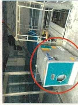
集塵機を設置し室内の換気を実施