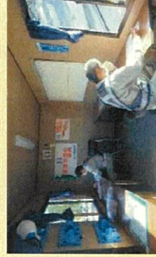
現場事務所での対人間隔の確保と換気