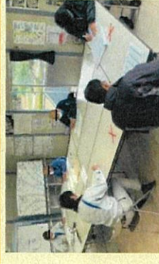
打合せ時の十分な対面距離の確保