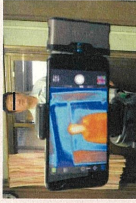
サーモグラフィカメラによる体温計測