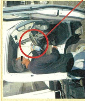
ハンドルやレバー等のアルコール消毒の徹底