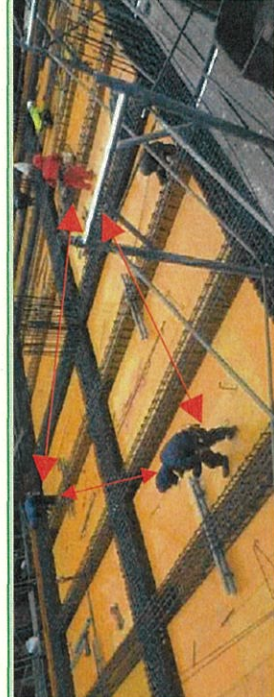
作業員の配置をブロック分けし密接した作業を回避