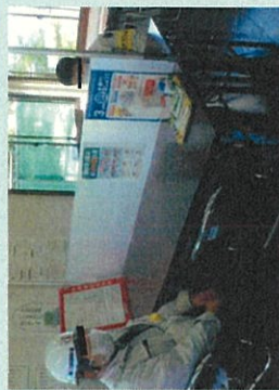
パーティションで密接を防止