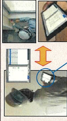
端末でチェック 通信端末 内容確認・是正