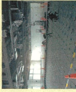
大部屋での作業も、フロア別に工程分けや人数を制限し実施