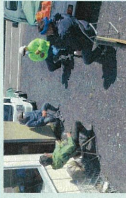
屋外で対人距離を確保して休憩