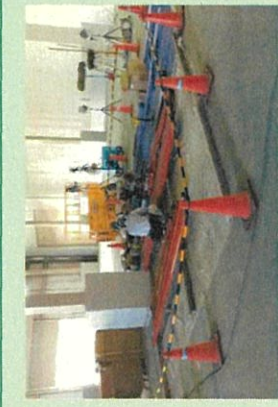
工事エリアの区画を設定して作業