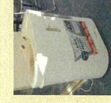
空気清浄機を設置