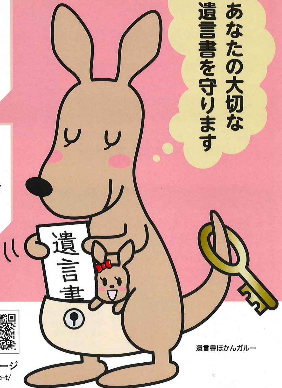
遺言書ほかんガルー