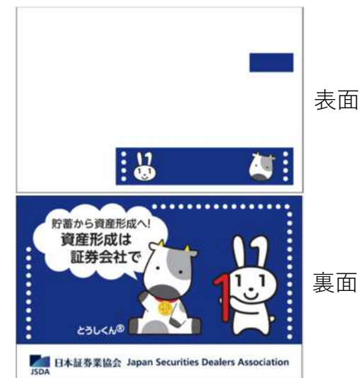
マイナンバーカード専用ケース