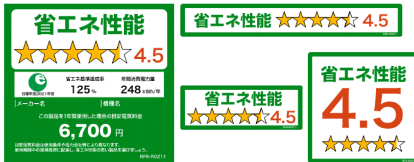
(冷蔵庫のイメージ)