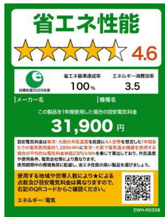
(電気温水機器のイメージ)

※照明器具、テレビジョン受信機、家庭用電気冷蔵庫、家庭用電気冷凍庫、温水機器及び電気便座については、2020年11月及び2021年8月に図5に変更済。今後、家庭用エアコンディショナーについても図5に倣ったものに変更予定。なお、温水機器以外は、製品のサイズやネット取引等の限られたスペースで使用する場合は右側のミニラベルを活用すること。