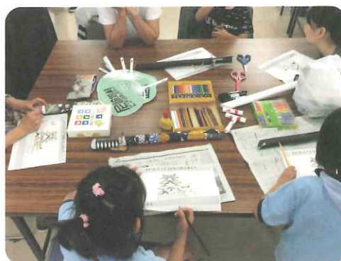
「護美奉行（ごみぶぎょう）」が使う「刀トング」をみんなで製作

阪神尼崎駅近くの商店街に、高齢者や子ども、商店街の活性化や住民のコミュニティづくりまで幅広い事業を行う協同労働の団体があります。設立したのは、この街で生まれ育った仲間たち。造園と介護事業をはじめ、子ども食堂の運営、児童デイサービス、地域の商店街活性化をめざしたイベント、地域連帯プロジェクトなど多彩な事業を展開しています。