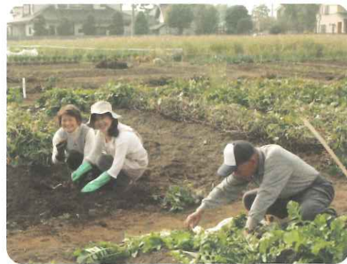
「親」も「地域」も「働く仲間」もみんなで楽しく畑仕事

埼玉県ふじみ野市にある平屋建ての地域密着型デイサービス。ここでは「自分の親を預けたいと思えるデイサービス」として知られています。周囲には畑が広がり、利用者は機能訓練を兼ねた農作業を楽しんでいます。収穫した野菜はデイサービスの食事として供され、「おいしい」と評判です。ここでは、農業と食、地域が生き活きとつながったデイサービス事業が実現しています。