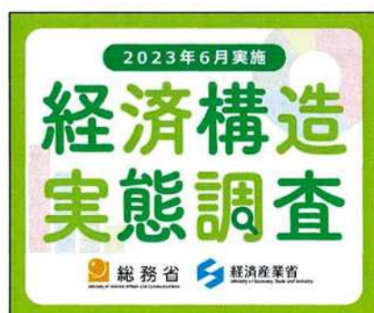
300 × 250 px