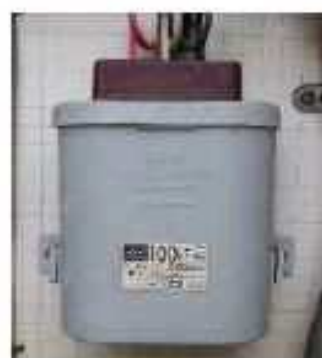
小型コンデンサー