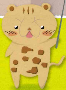
土地政策のイメージキャラクター とちーた